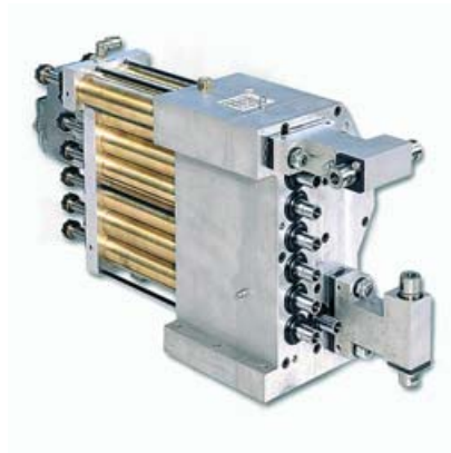
Borrlådor & spindlar