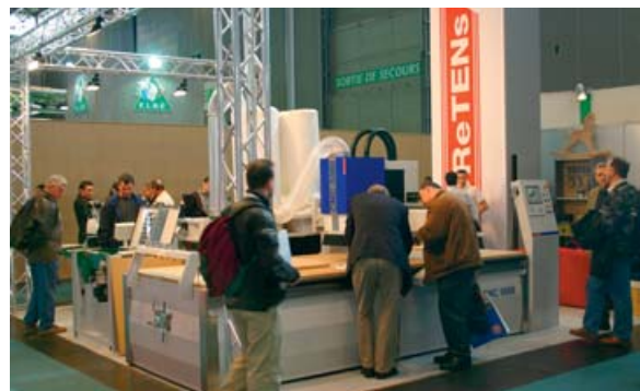
Utställning av vår CNC 5000 i Paris

MOReTENS tillverkningsenhet i Östersund. Här tillverkas alla våra maskiner till högsta kvalitetsstandard.